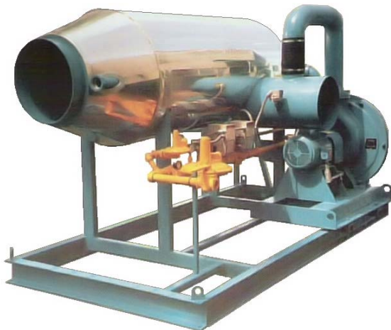
Table de support pour collecteur horizontal avec boîtier d'insonorisation. Le boîtier d'insonorisation comprend un collecteur et un ventilateur servant à éliminer l'air chaud et humide du boîtier. Pour cette unité, les tests sonores réalisés sur le terrain ont donné des résultats inférieurs à 85 décibels.

Réchauffeur à combustion directe de gaz avec dispositif de commande des soupapes de type "IRI", soufflerie de combustion et panneau de commande de protection du réchauffeur. Les fonctions d'arrêt de sécurité comprennent des dispositifs pour haute ou basse pression du gaz, faible débit d'air de combustion, faible débit d'air principal et haute température. Cette unité est conçue pour fournir une température de refoulement située entre 300° F et 350° F (149° C et 177° C) avec le seuil de haute température défini à 450° F (232° C).